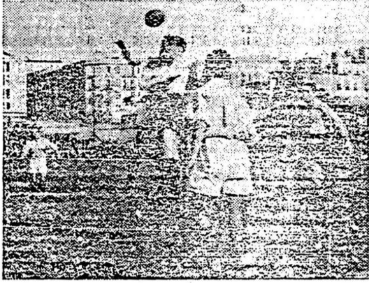
AYER, EN EL CAMPO DE LAS DELICIAS. — Una fase del encuentro entre los equipos de la Ferroviaria y el Girona, terminado con el triunfo del equipo propietario del campo por tres tantos a uno.

En la primera parte, más movida que la segunda, un saque de esquina contra el Girona fue lan-